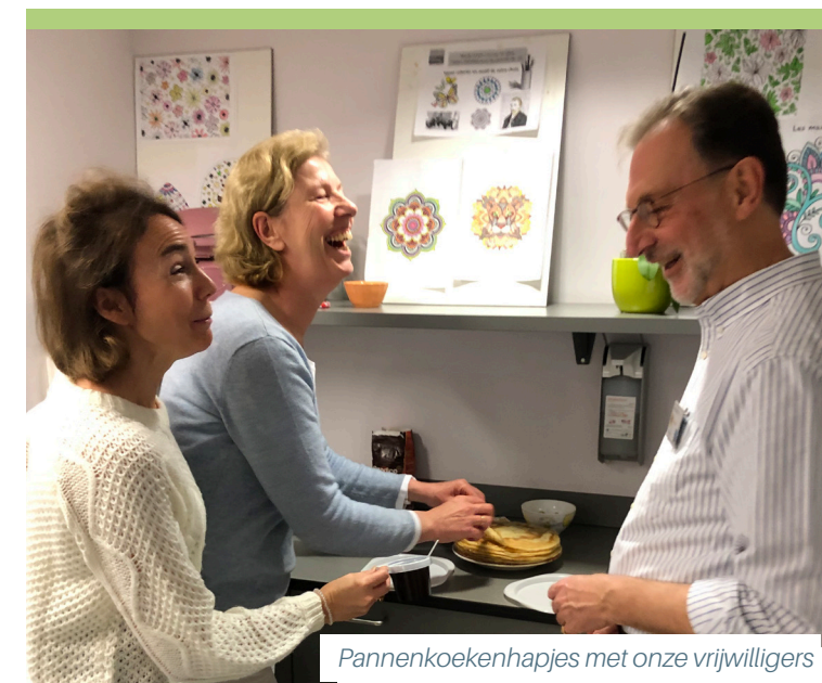
Pannenkoekenhapjes met onze vrijwilligers